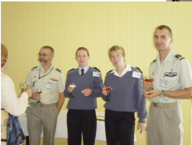
Les gentils organisateurs