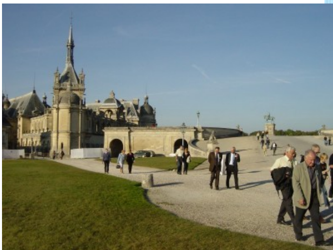
Château de Chantilly