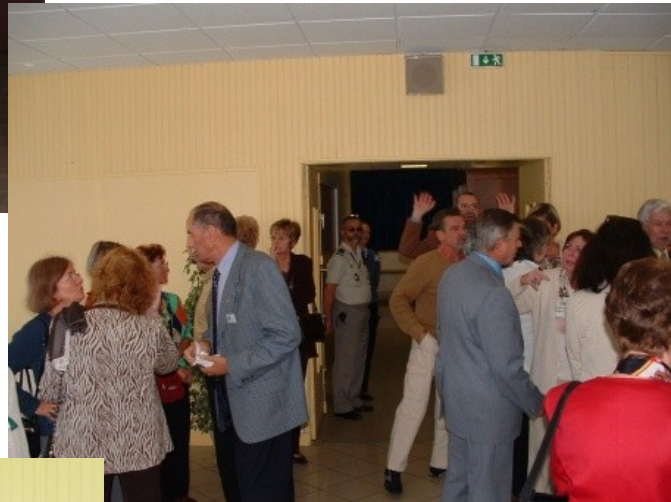
Préparation aux agapes