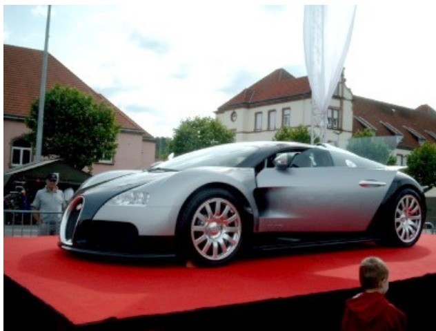
La méhari F II