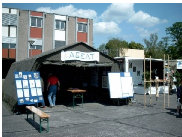
L'AGEAT en manoeuvre à Oberhoffen

L'ancien et le nouveau se côtoient harmonieusement