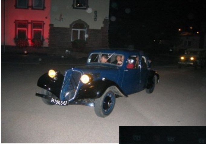
Arrivée des autorités

Commémoration du 60 ème anniversaire de la libération de l'Alace