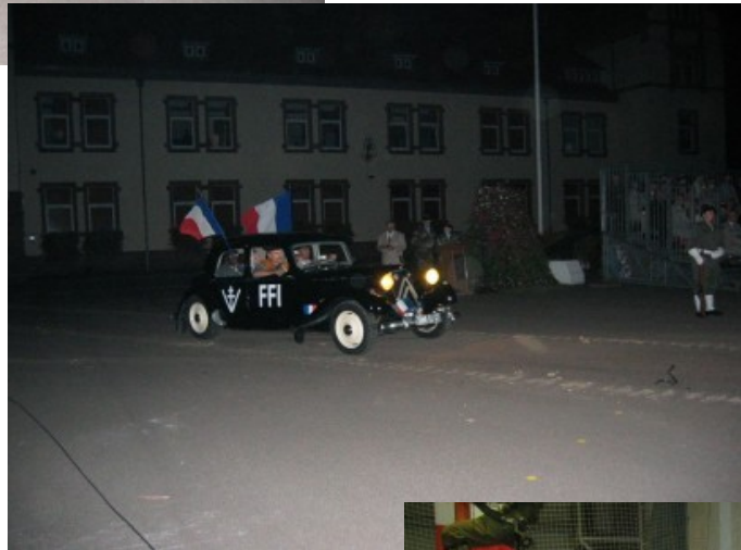
Au faisceau !

Fresque historique : arrivées des combattants de l'ombre