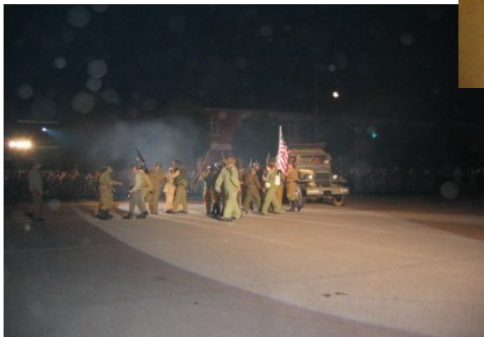
Fresque historique : jonction des troupes américaines et soviétiques à TORGAU