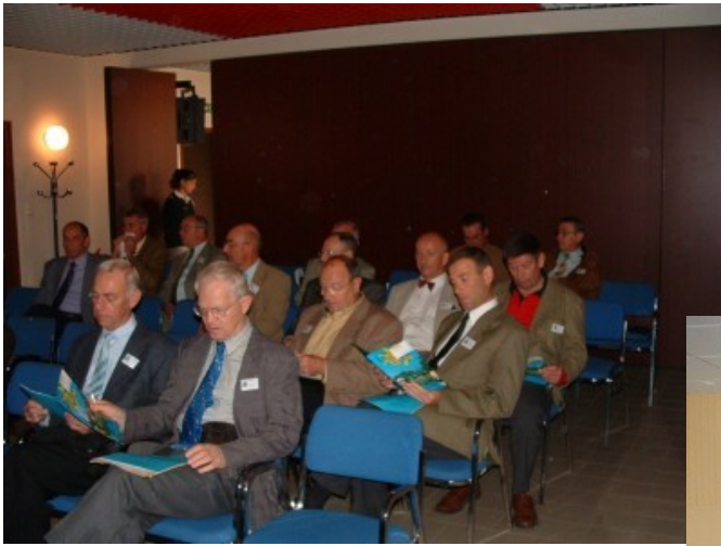
Ambiance studieuse pendant les travaux de l'assemblée