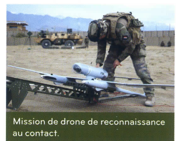
Mission de drone de reconnaissance au contact.